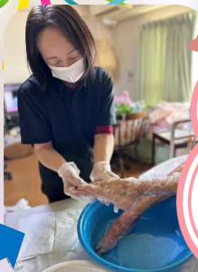
手際よく清潔ケア