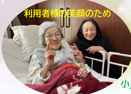
小児も訪問します