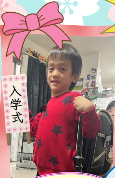
黒衣利用開始当初の Rくん